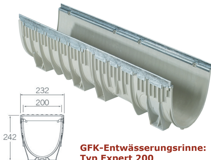
GFK-Entwässerungsrinne: Typ Expert 200

Für die GFK-Entwässerungsrinne Expert stehen Roste in den Varianten verzinkter Steg- und Maschenrost, sowie Gussrost zur Verfügung. Zur Rostsicherung empfehlen wir unser Rostsicherungssystem Starfix .