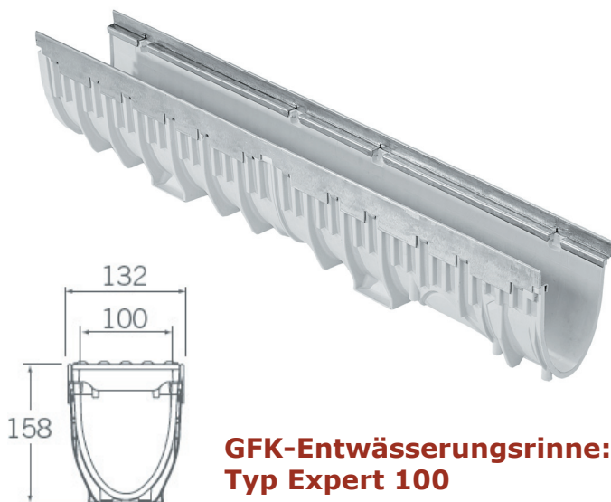
GFK-Entwässerungsrinne: Typ Expert 100