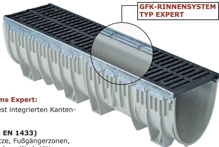
GFK-RINNENSYSTEM TYP EXPERT